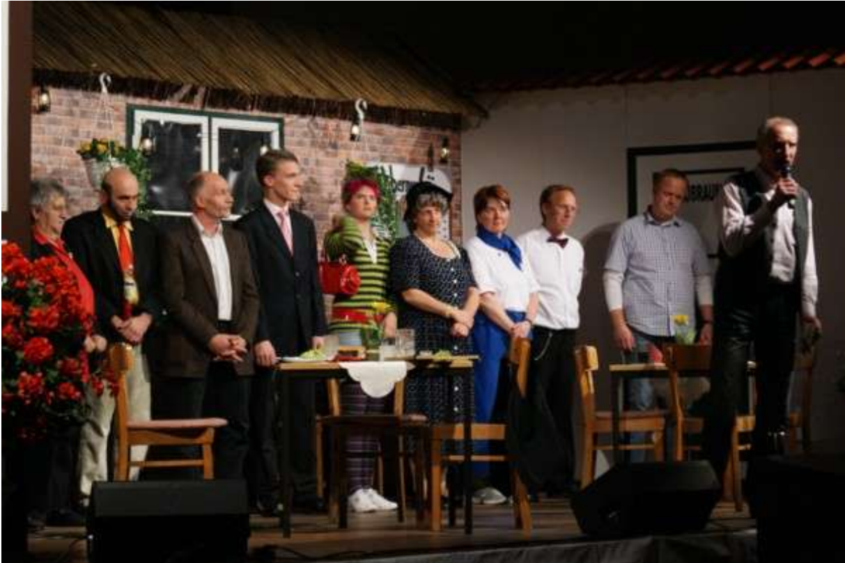
Großer Beifall für die Theatergruppe der Feuerwehr Kiebitzreihe

Für die, die dablieben, ist der Auftritt von Steve Crown and the Slapping Candies schon Tradition. Bis kurz vor Mitternacht wurde zu den Rockabilly-Klängen generationsübergreifend getanzt. Die Veranstaltung löste sich erst weit nach Mitternacht auf.