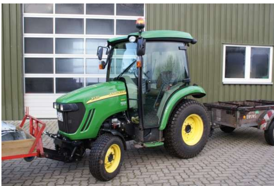
Für unsere Gemeinde im Einsatz: der neue Gemeindeschlepper