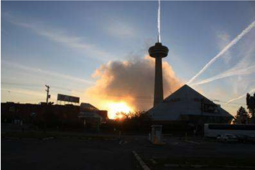
Niagara Falle - Gischtwolke in der Morgensonne