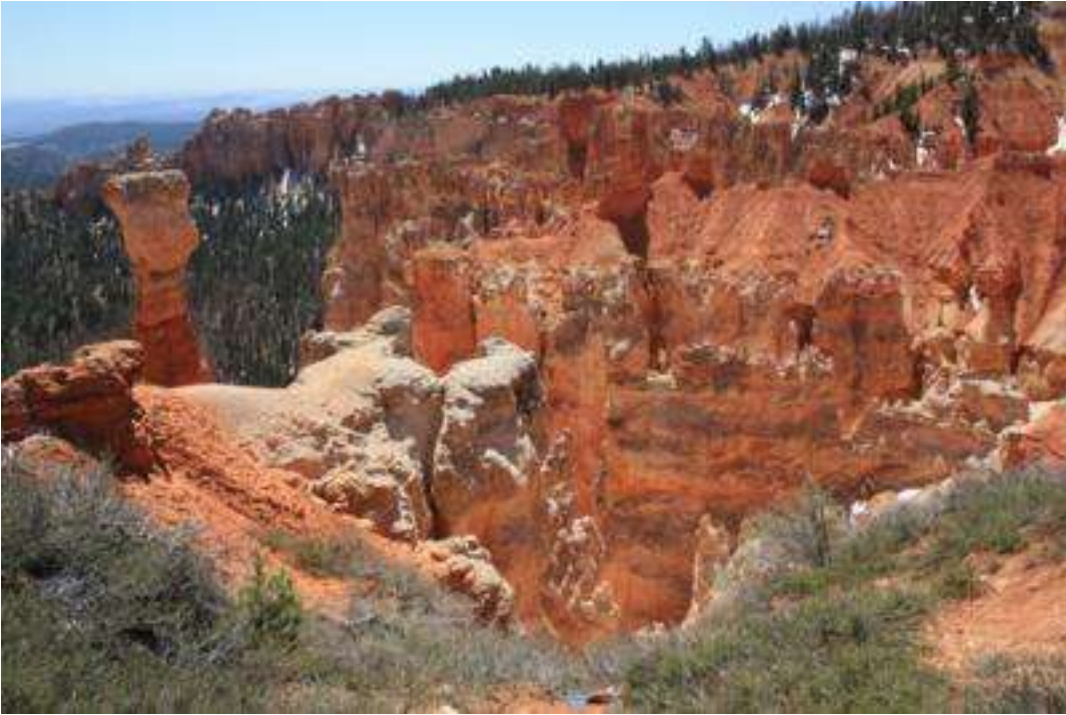
Nationalpark Talampaya Catamarca