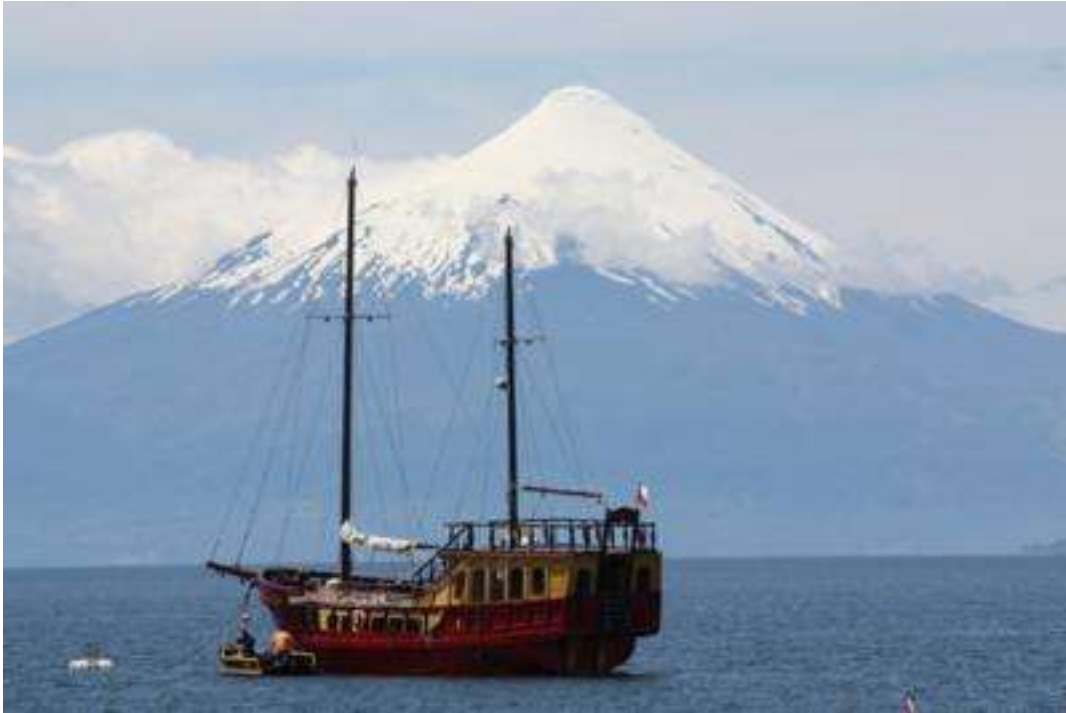
Puerto Varas - Vulkan Osorno