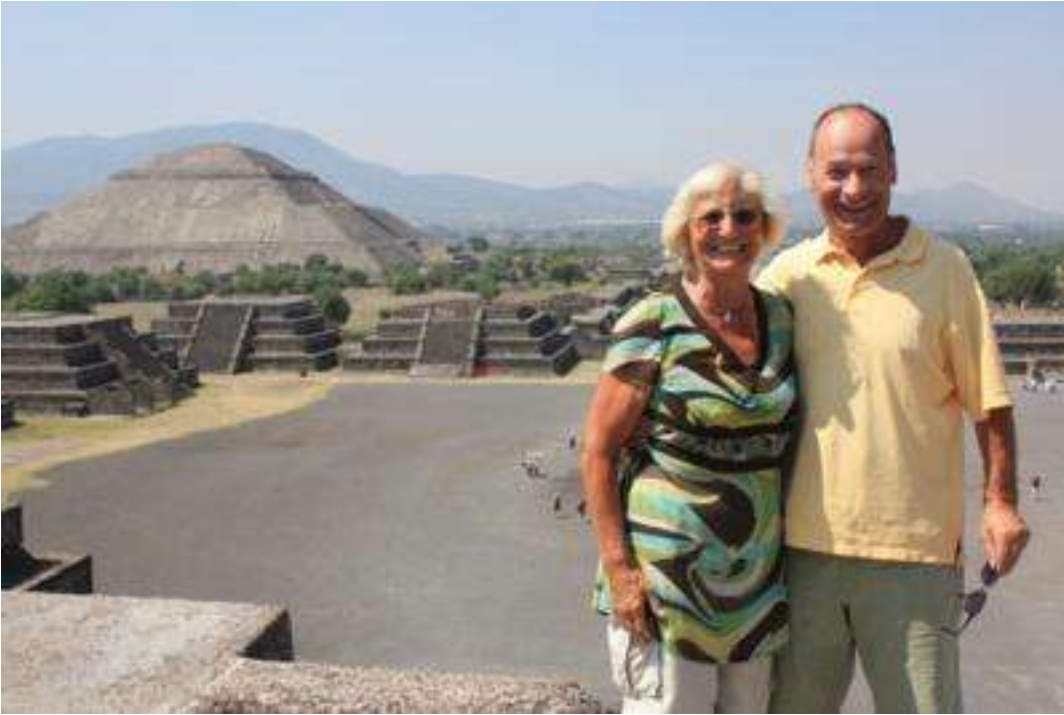
Guatemala - Maya Stätte Tikal