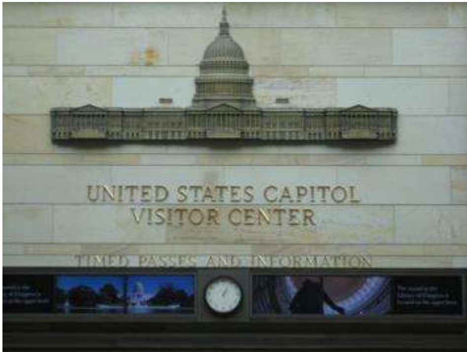
USA - Washington DC - Capitol