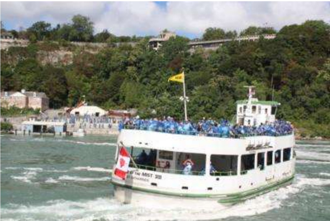
Kanada / USA Niagara Falle