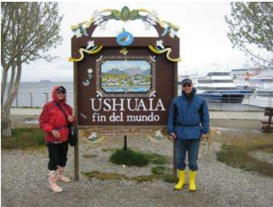
Am Ende der Welt - Ushuaia auf Feuerland