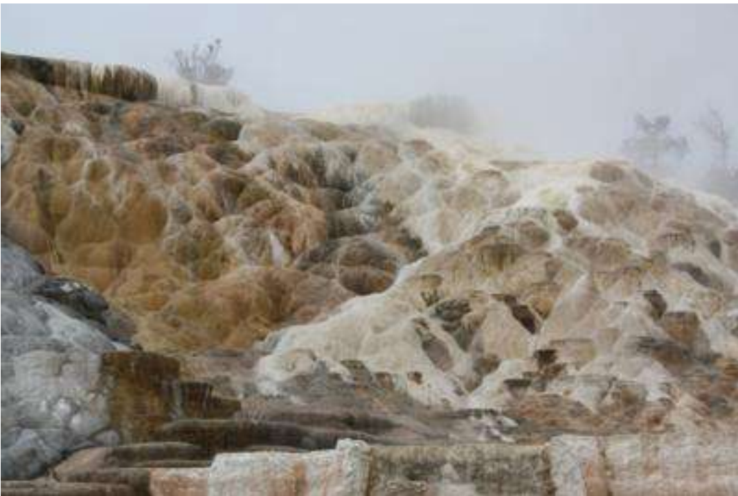
USA - Wyoming - Yellowstone Nationalpark