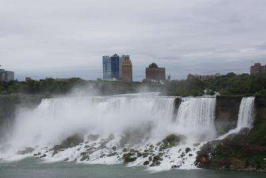
Kanada / USA Niagara Falle