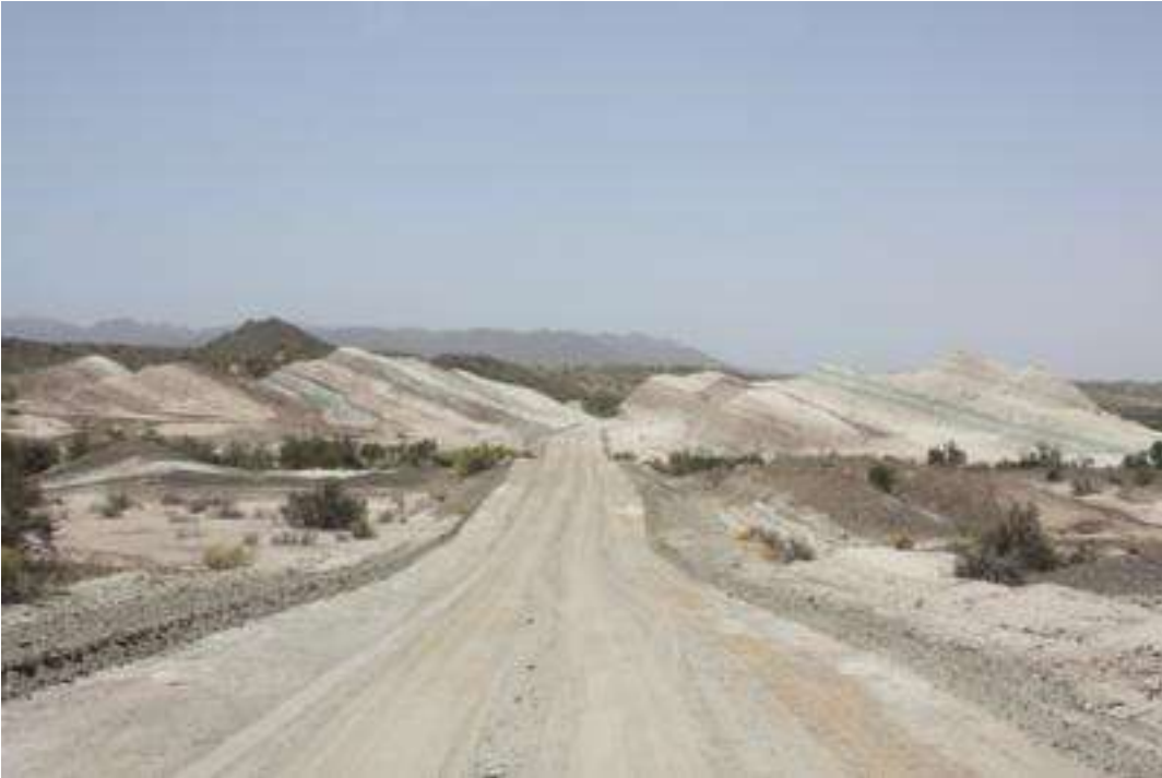
Nationalpark Talampaya Catamarca