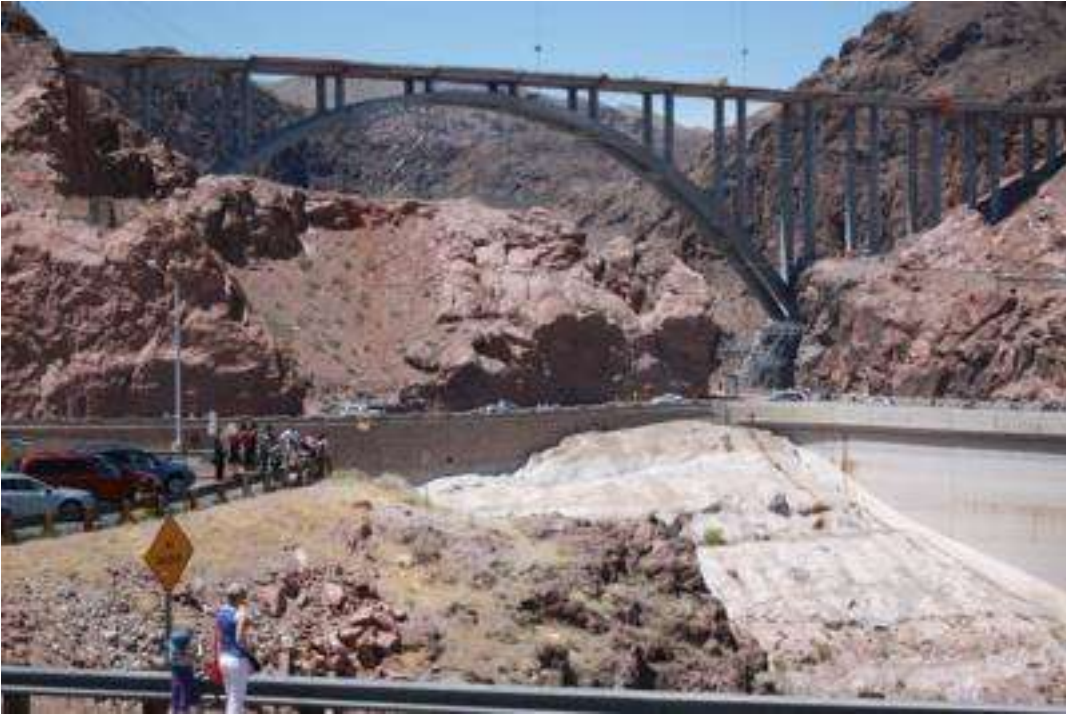
USA - Nevada - Hoover Dam