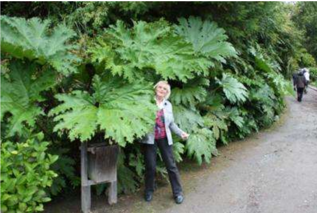
Chile - Riesenrhabarber