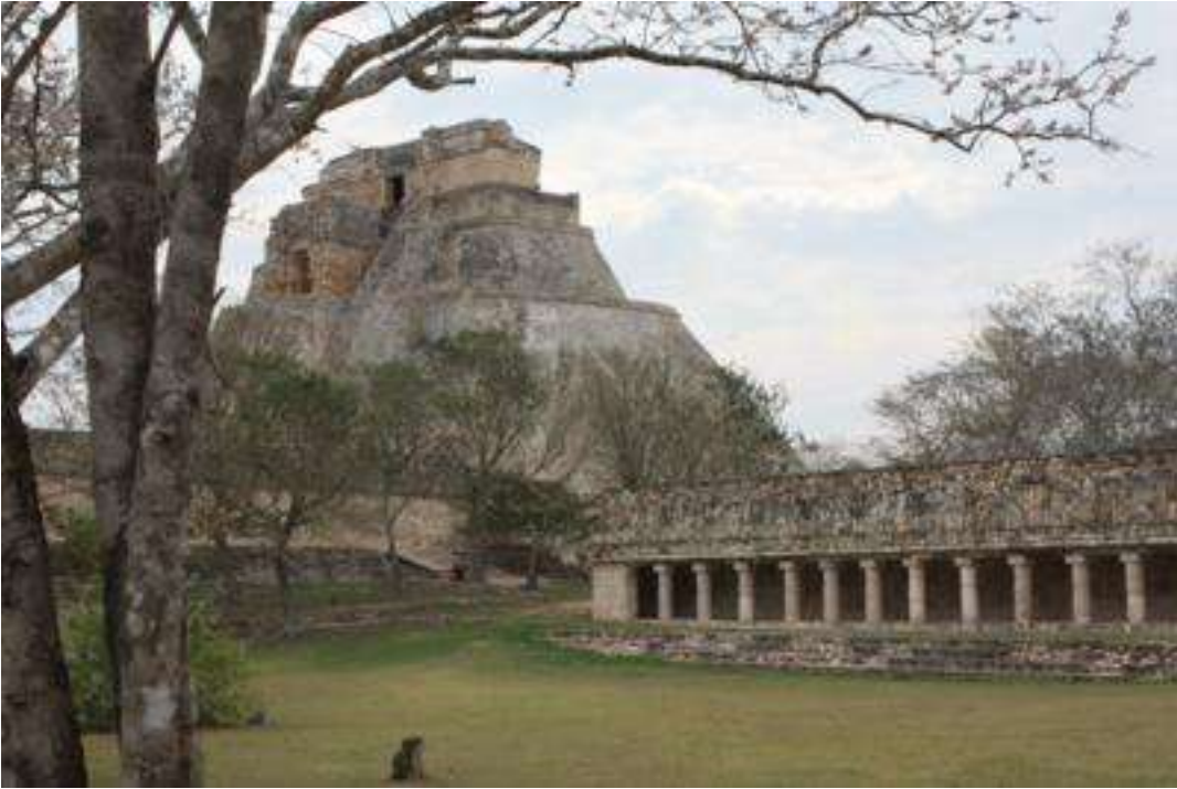
Guatemala - Maya - Stätten Tikal