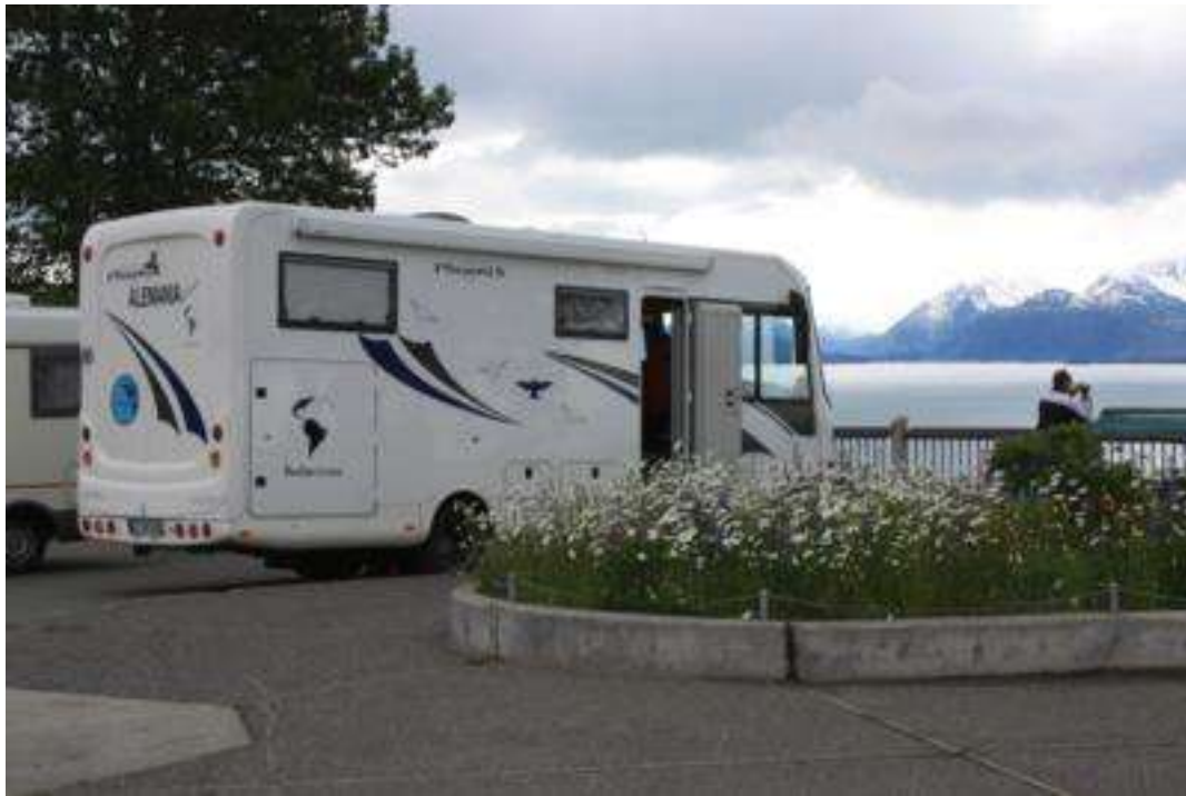
Alaska - Homer (Fischerort)