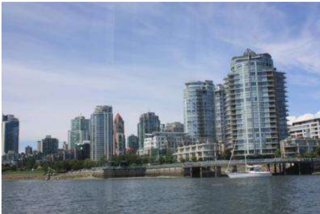
Kanada - Vancouver