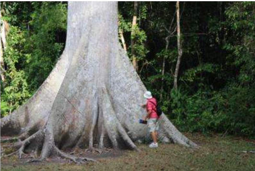
Guatemala - Maya Stätten Tikal