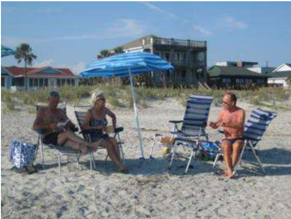
USA - South Carolina - Folly Beach