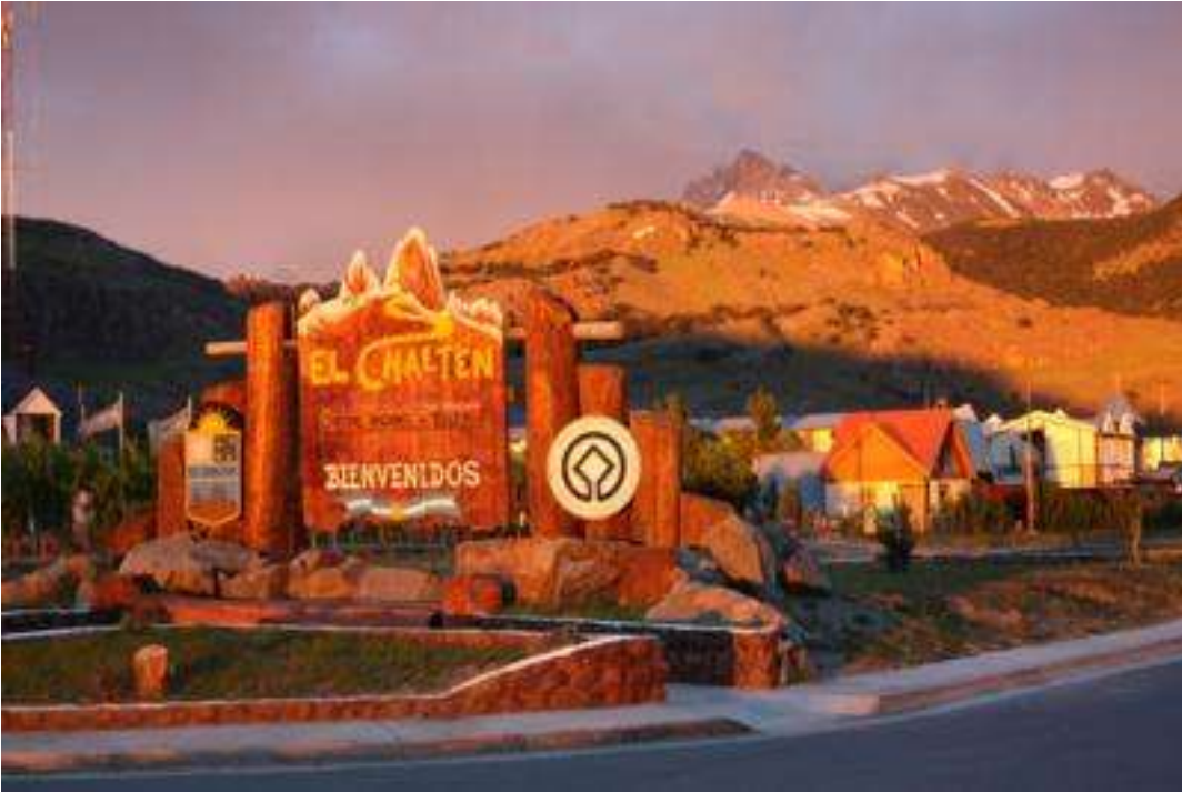
Argentinien - Nationalpark Torres del Plaine