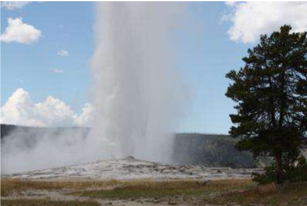
USA - Wyoming - Yellowstone Nationalpark - Geysier Old Faithfull