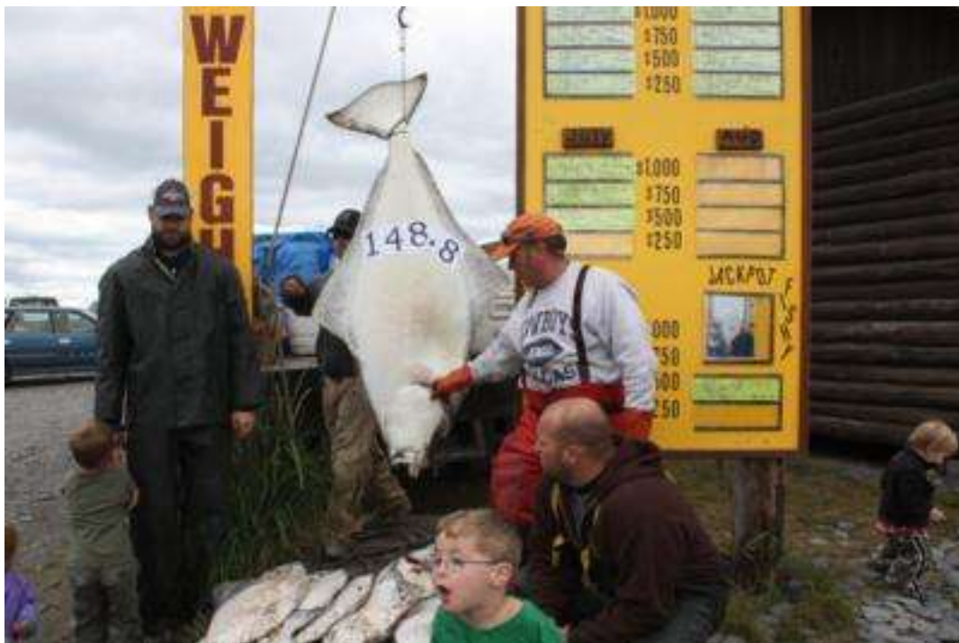
Alaska - Homer (Fischerort) - Heilbutt mit 148,8 Kg