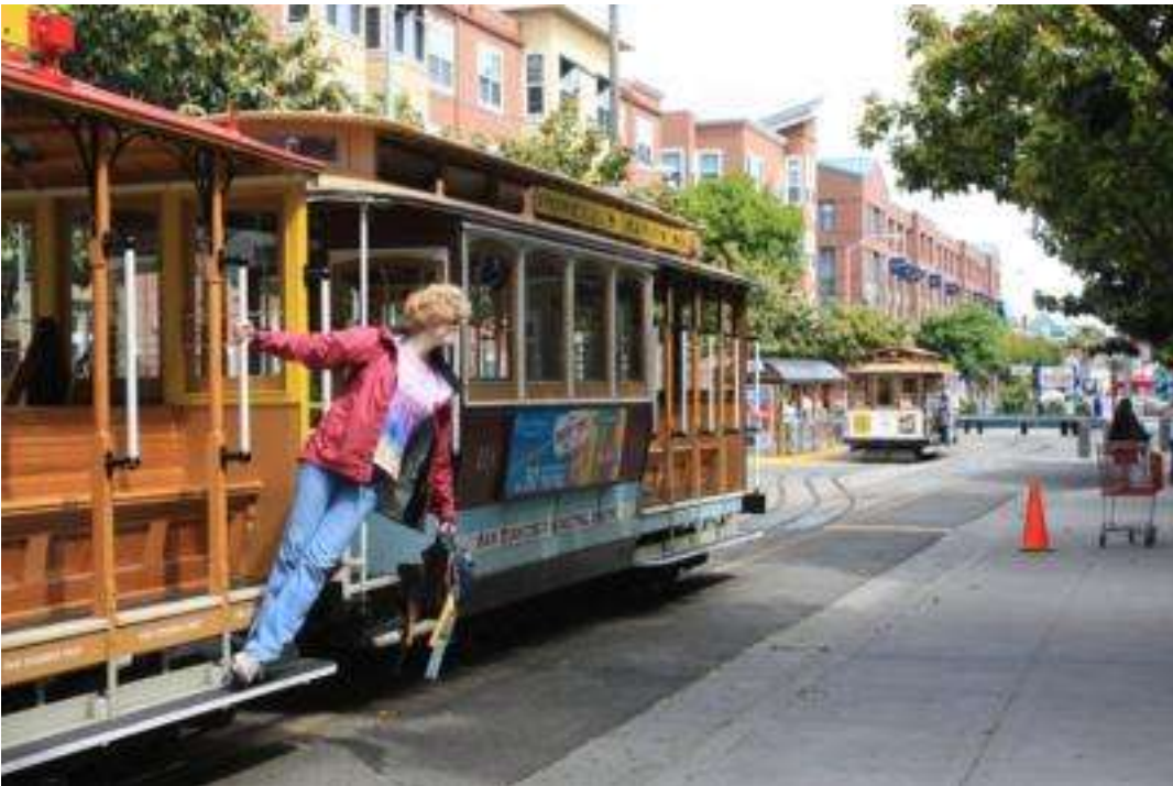
USA - San Francisco - Cable Car