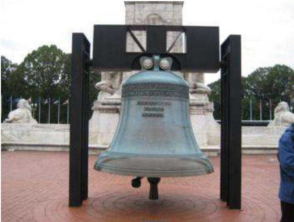
USA - Washington DC