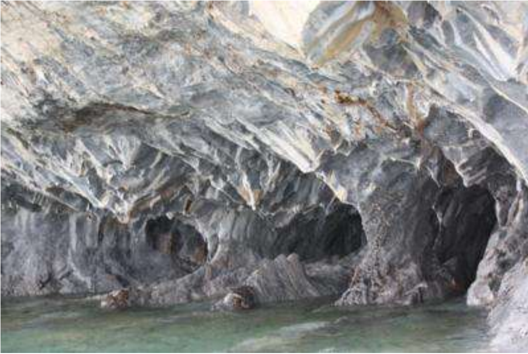
Chile - Puerto Río Traquilo - Marmorinseln