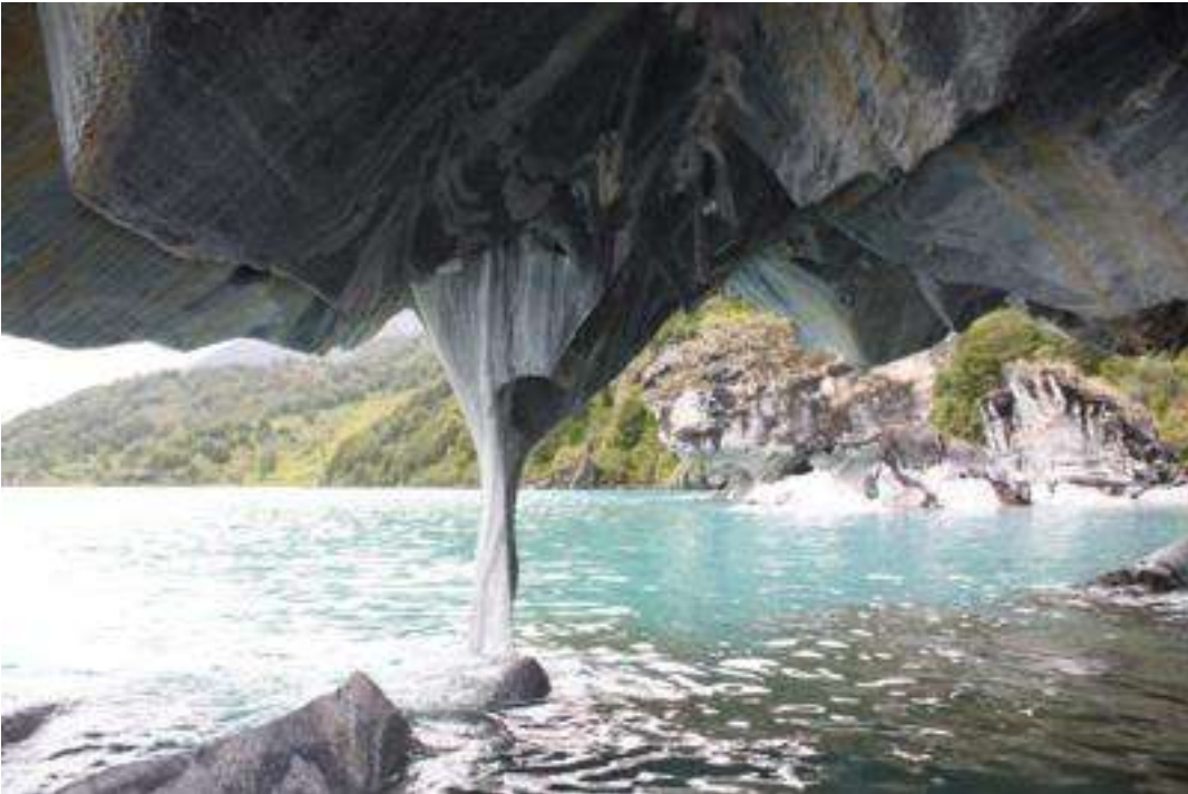
Chile - Puerto Río Traquilo - Marmorinseln