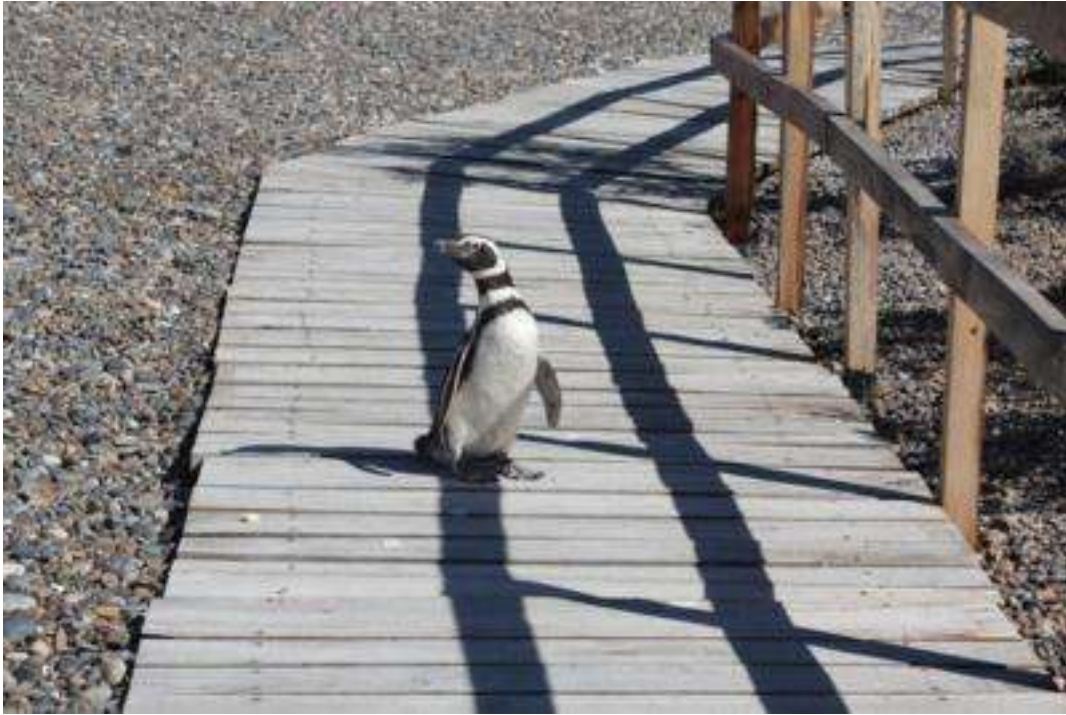
Nationalpark Punto Tombo