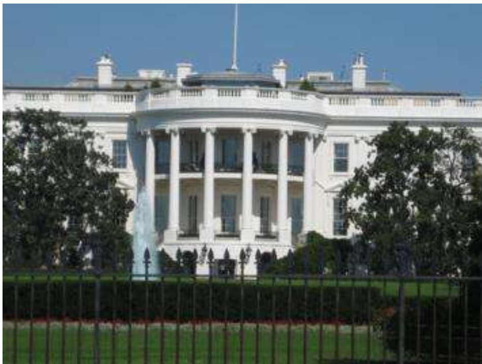
USA - Washington DC - Weißes Haus