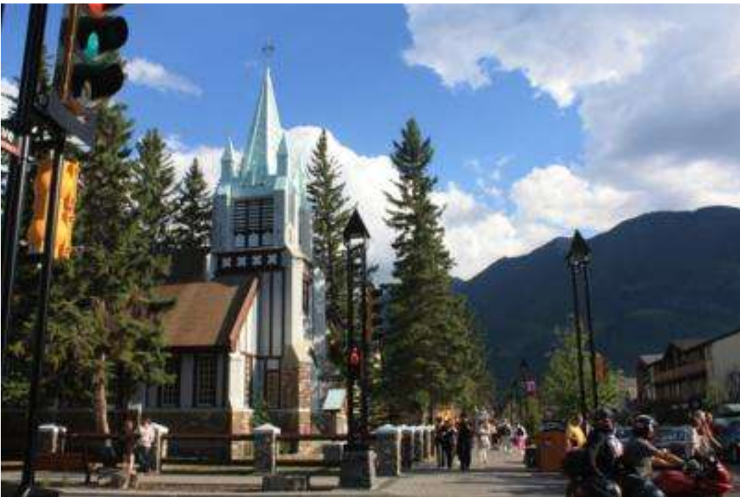
Kanada - Nationalpark Banff