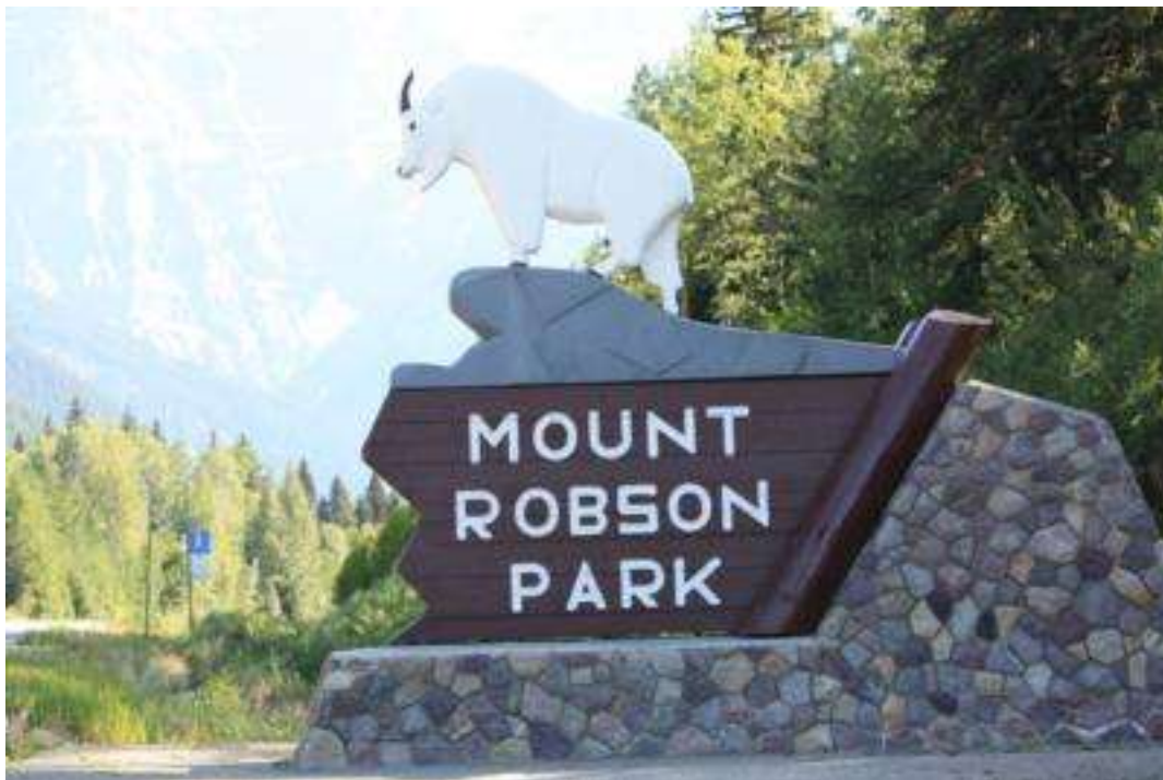
Kanada - Jasper Nationalpark