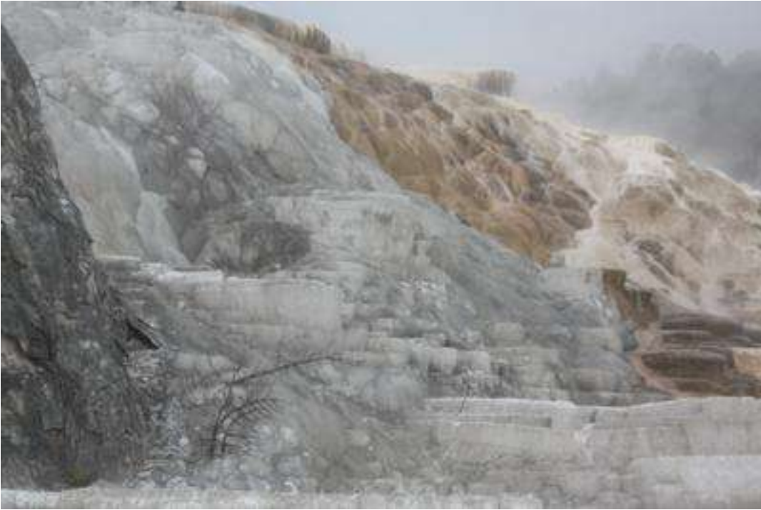
USA - Wyoming - Yellowstone Nationalpark