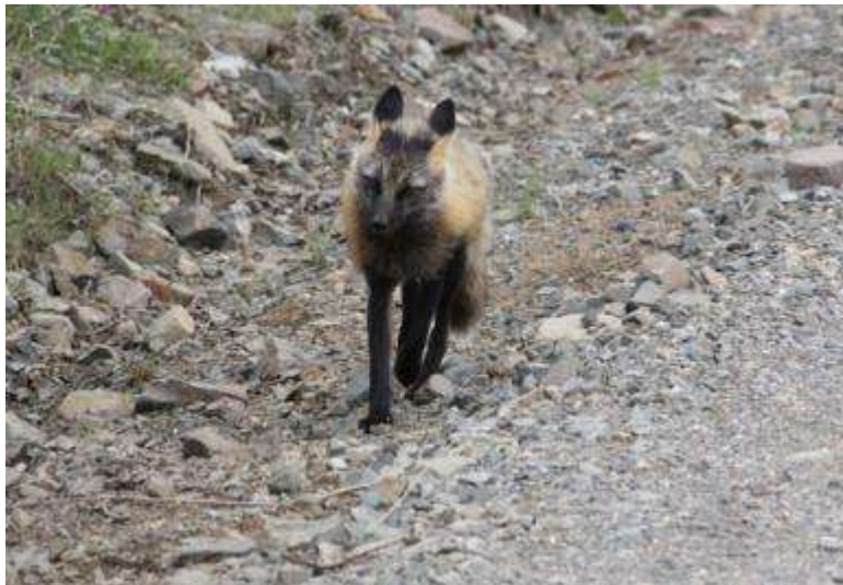
Alaska - Denali - Nationalpark