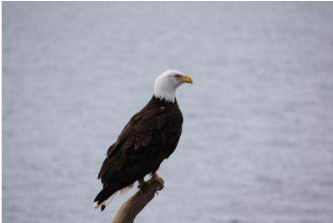
Alaska - Homer - Weißkopfadler