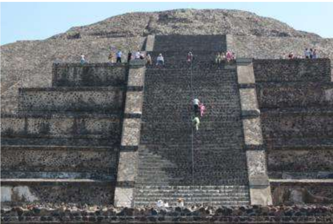
Guatemala - Maya Stätte Tikal