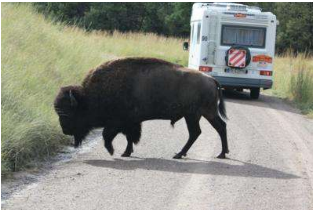
USA - Montana - Moise Bison Park - Geweihstapel