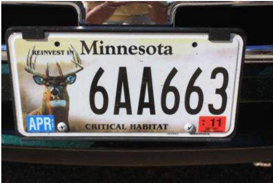
Kennzeichen in Minnesota -