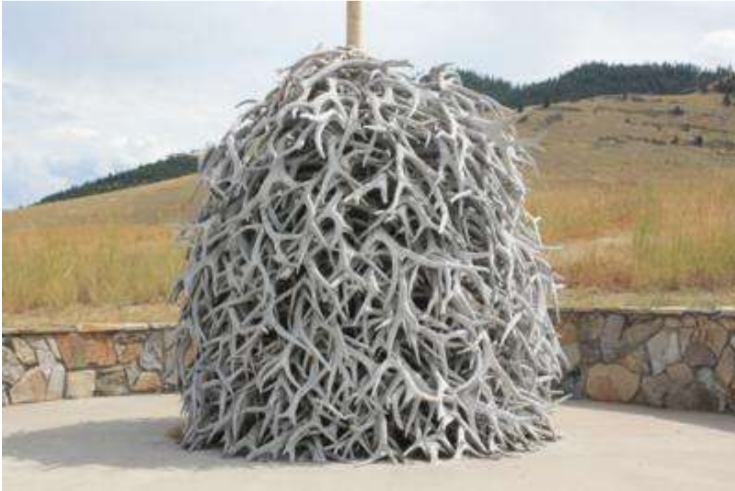
USA - Montana - Moise Bison Park - Geweihstapel