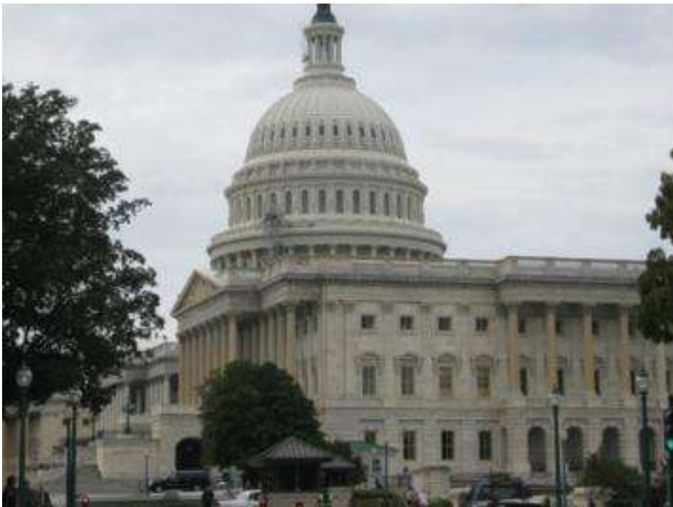
USA - Washington DC - Capitol