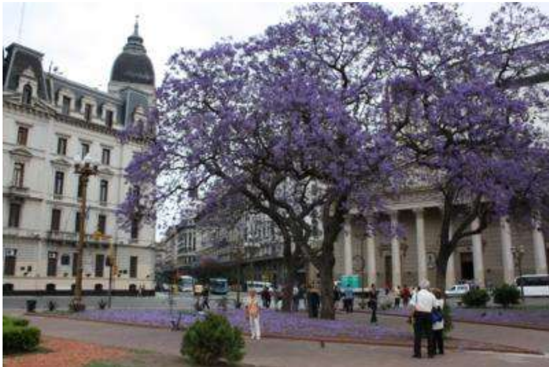
Buenos Aires Lacanranje Baum