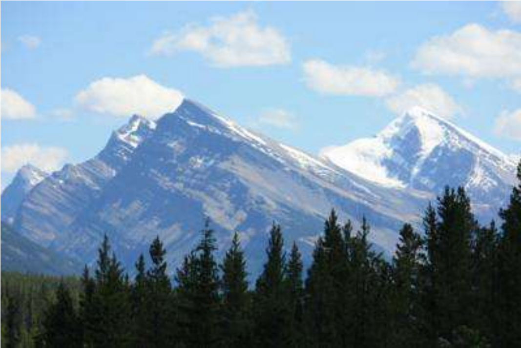
Kanada - Jasper Nationalpark