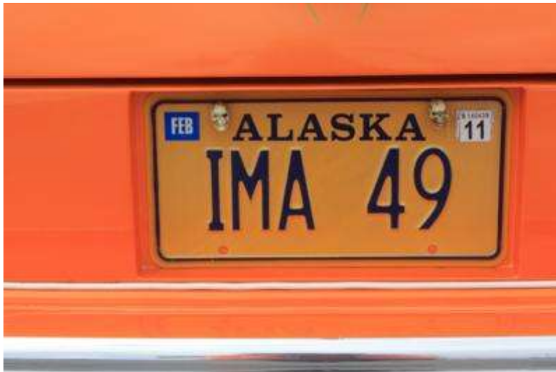
Nummernschild in Alaska