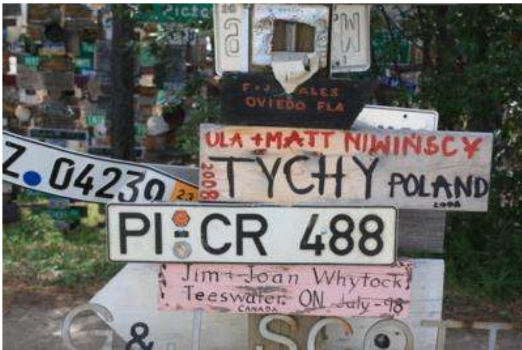
Kanada - Yukon - Watsen Lake