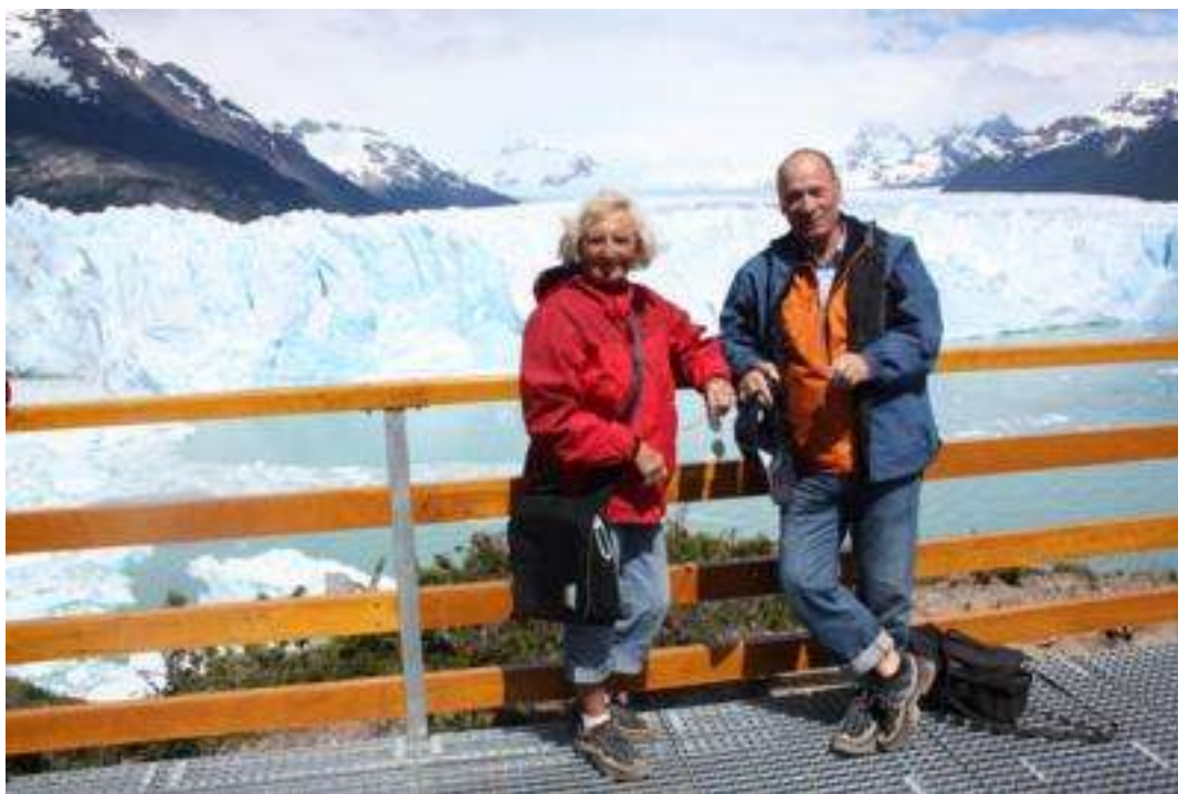
Argentinien Perito Moreno