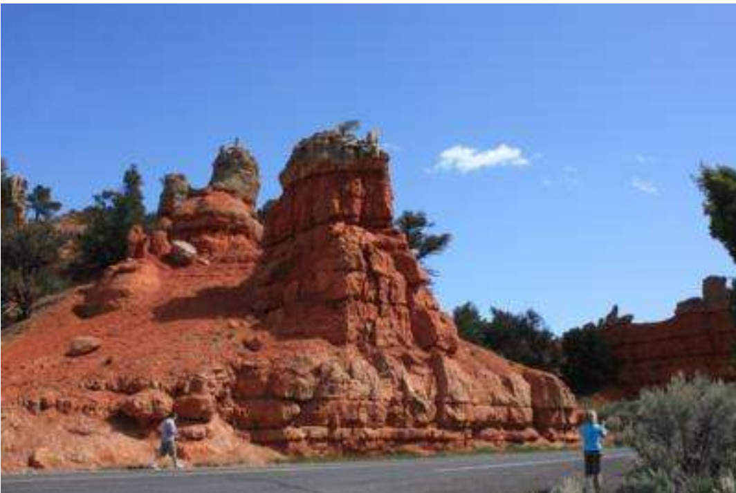
Nationalpark Talampaya Catamarca