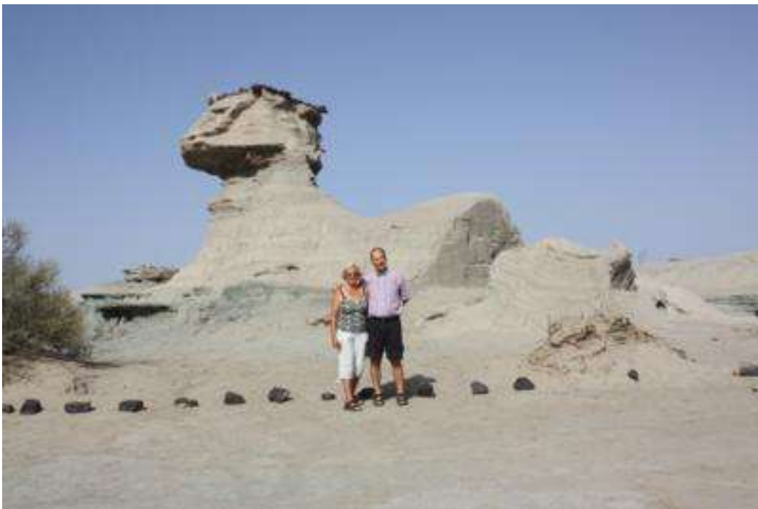
Nationalpark Talampaya Catamarca