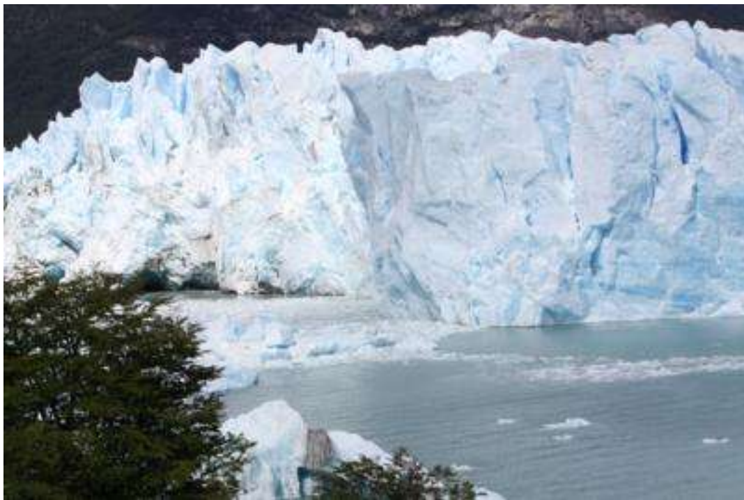
Argentinien Perito Moreno