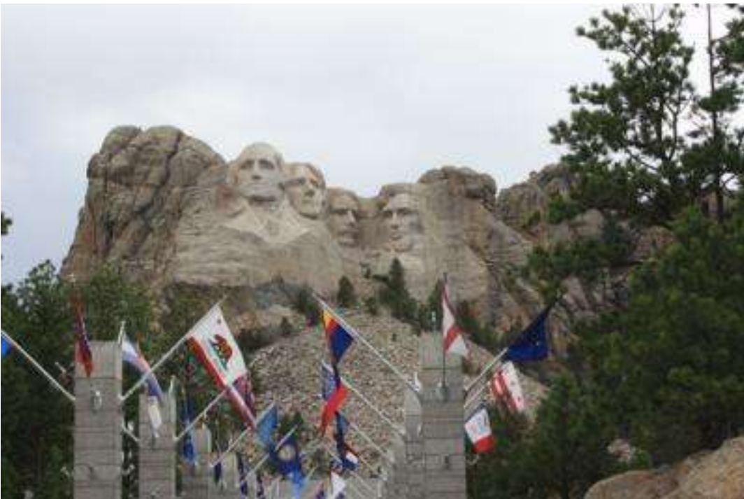
USA - South Dakota - Mount Rushmore