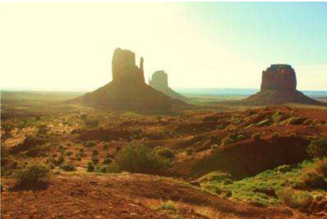
USA - Utah - Monument Valley