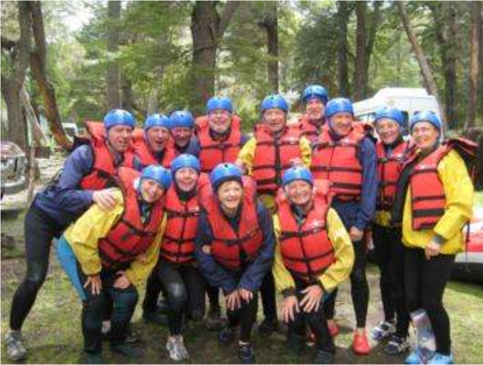
Chile - Lago Steffen - Rafting