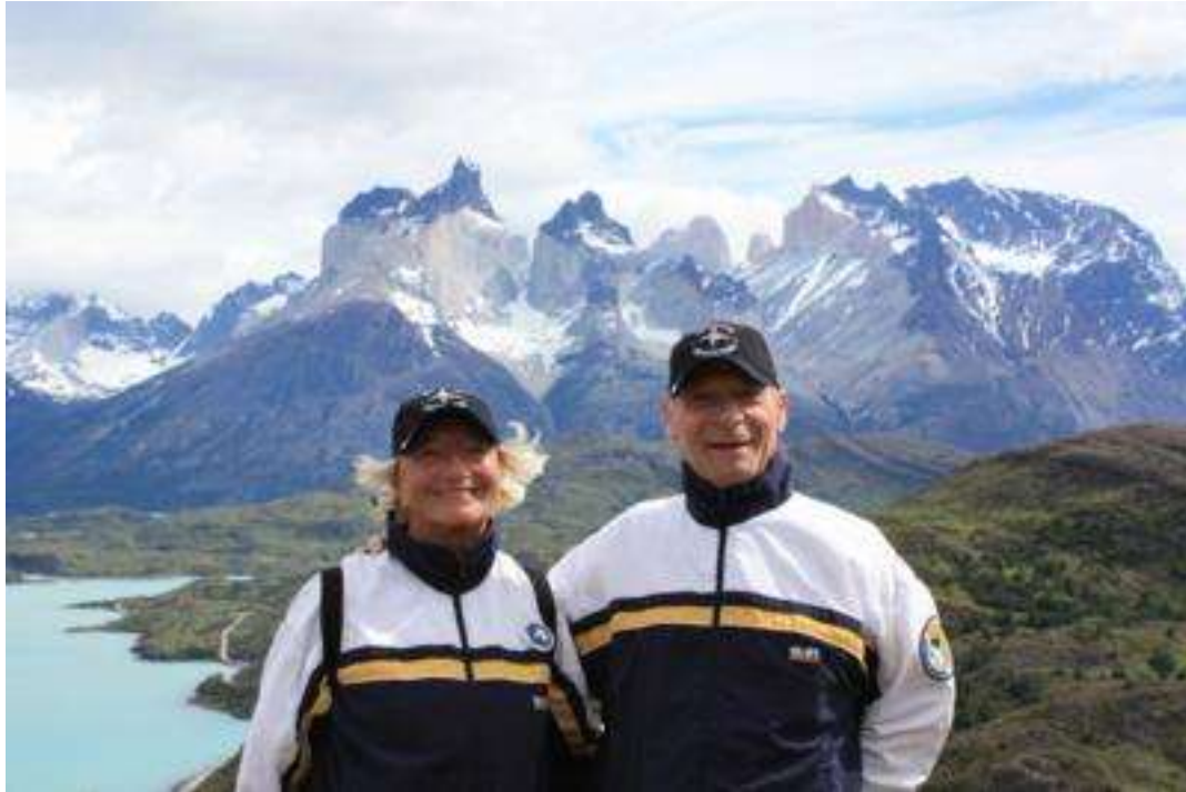
Argentinien Nationalpark - Torres del Paine