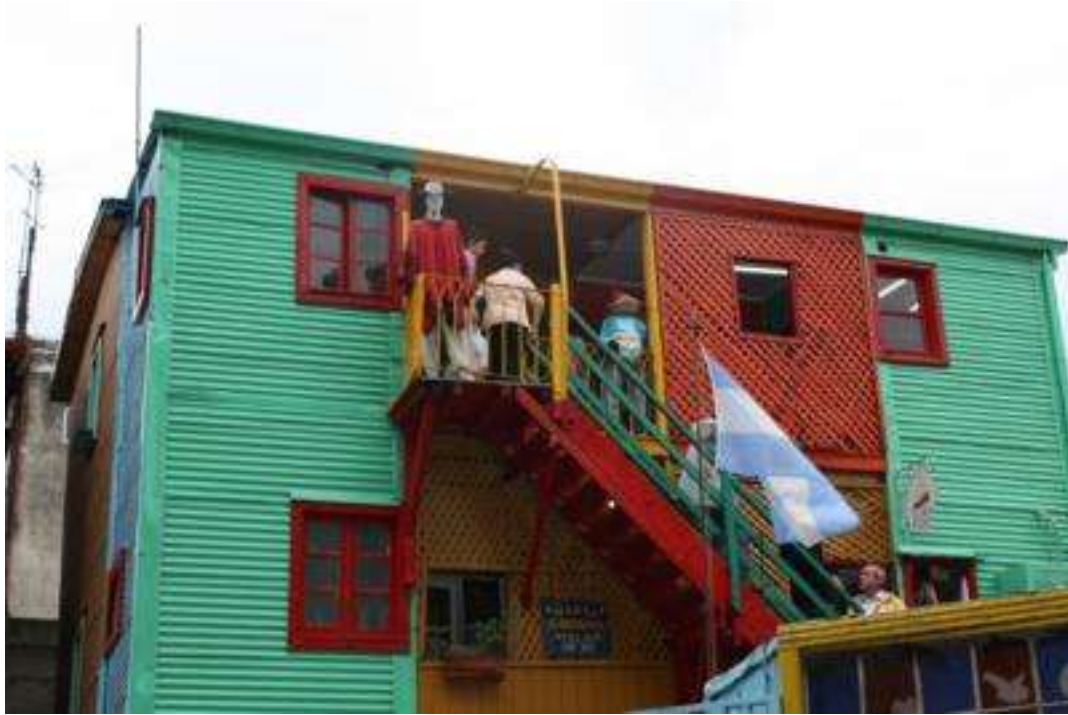
Buenos Aires - La Bocca