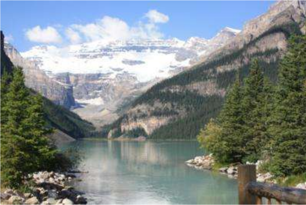
Kanada - Jasper Nationalpark Lake Louise