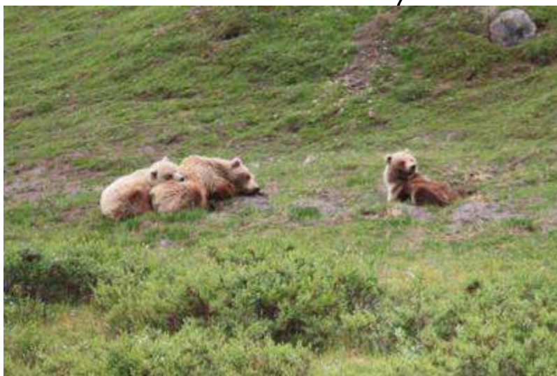
Alaska - Denali - Nationalpark