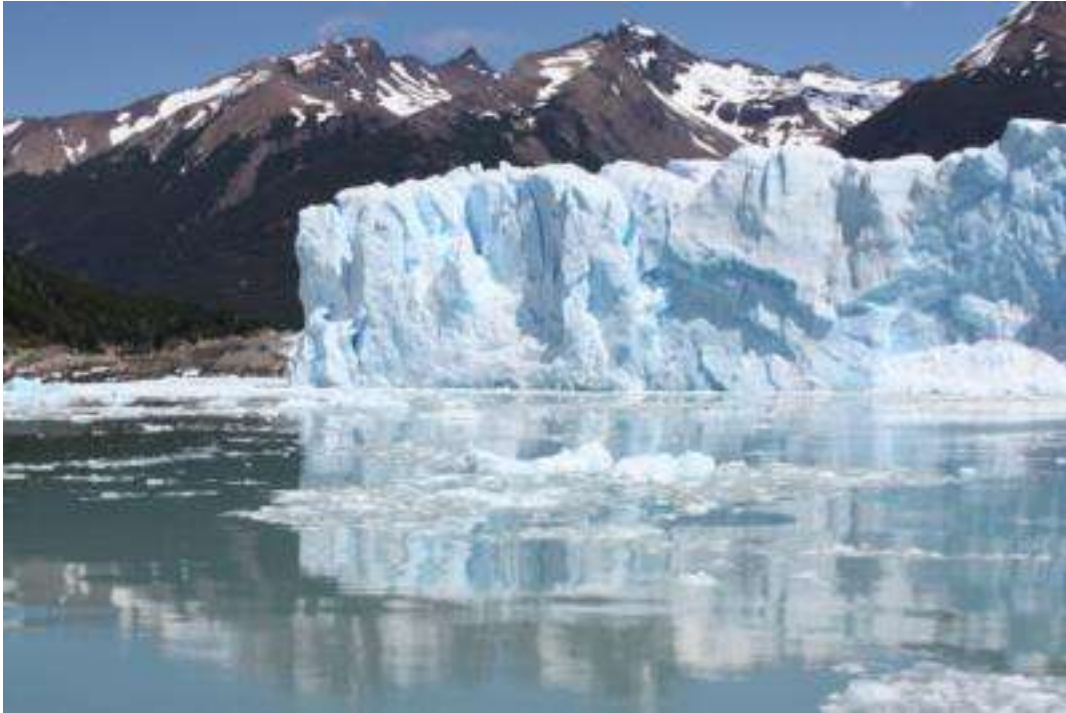
Argentinien Nationalpark Upsala Gletscher