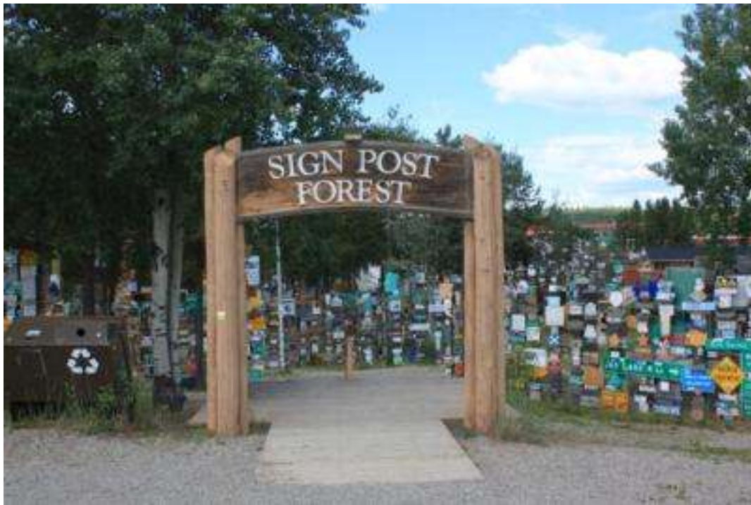
Kanada - Yukon - Watsen Lake