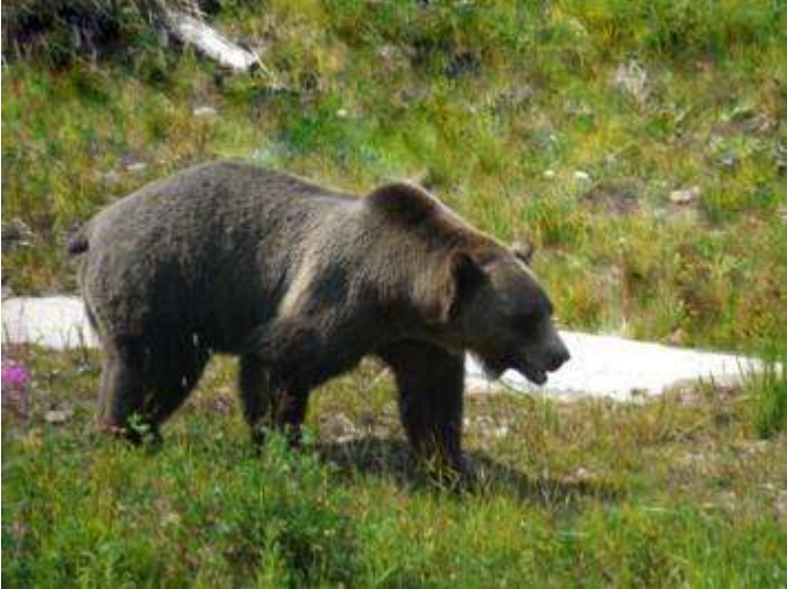
Kanada Yukon Beaver Creek