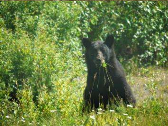
Beaver Creek Yukon Kanada