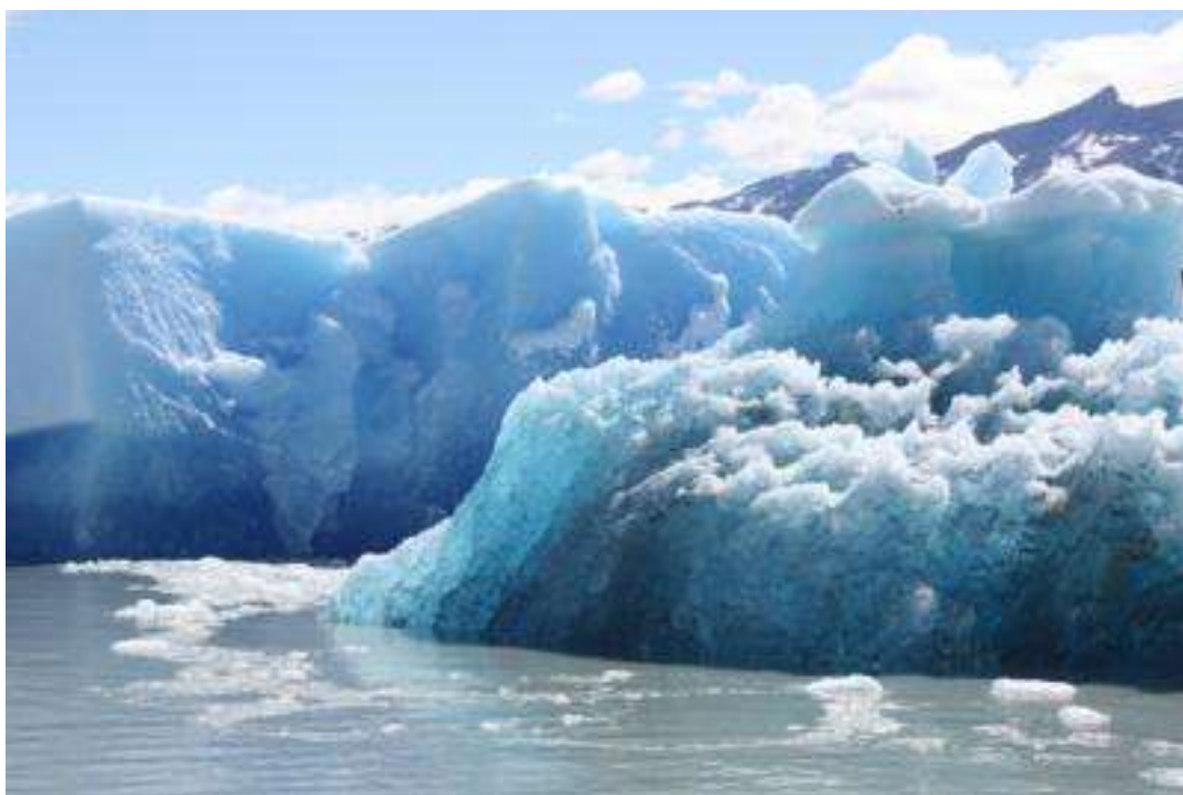
Argentinien Nationalpark Upsala Gletscher