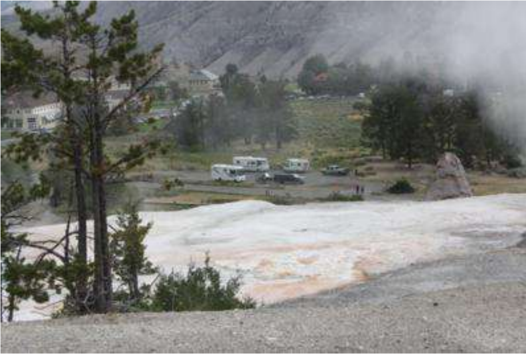
USA - Wyoming - Yellowstone Nationalpark