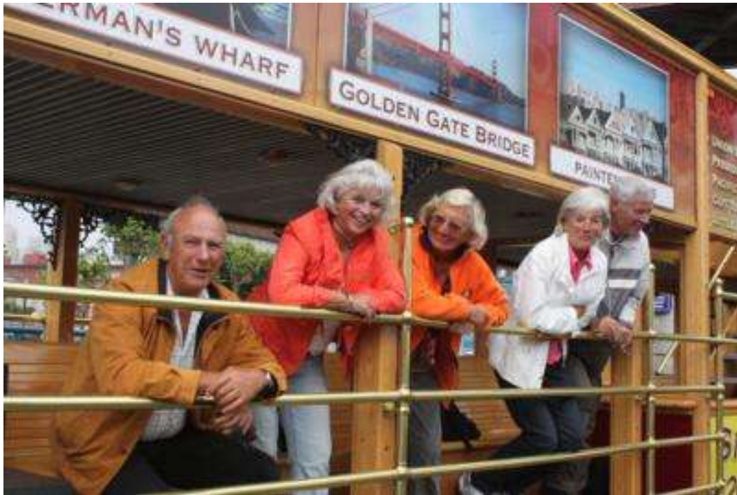
San Francisco - Cable Car