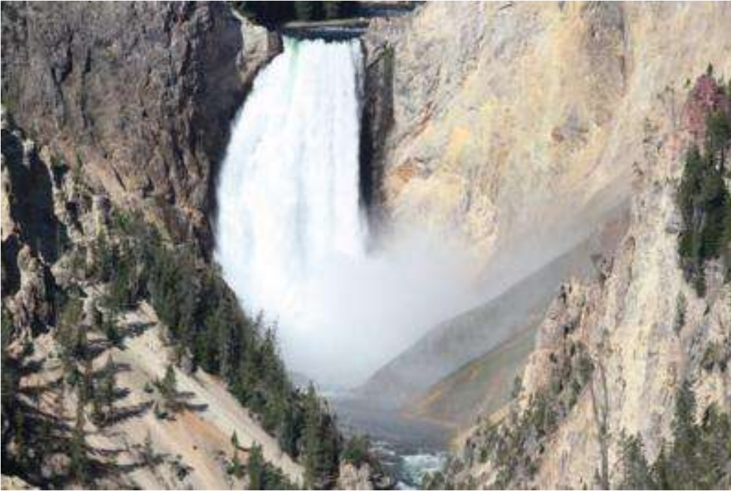
USA - Wyoming - South Drive Canyon