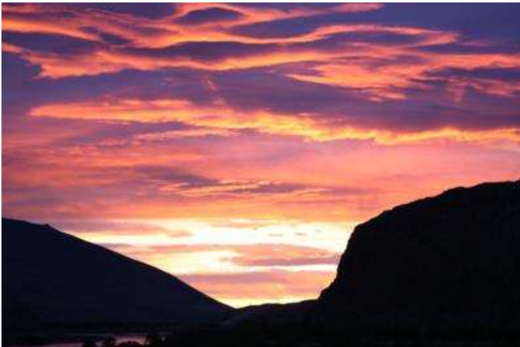
Argentinien - Nationalpark Torres del Plaine - Sonnenaufgang