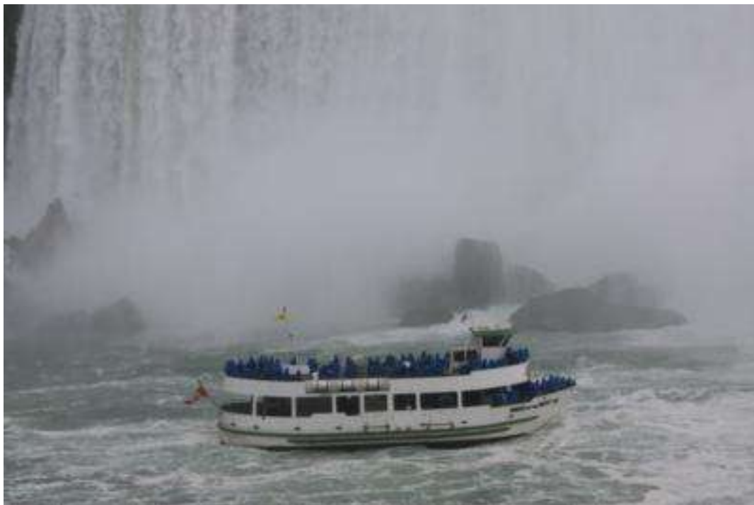
Kanada / USA Niagara Fälle